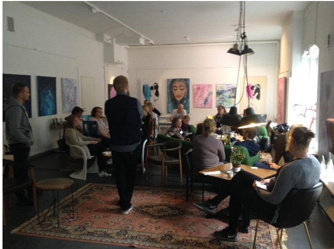
Lopussa keskusteltiin vielä koko porukan kesken.